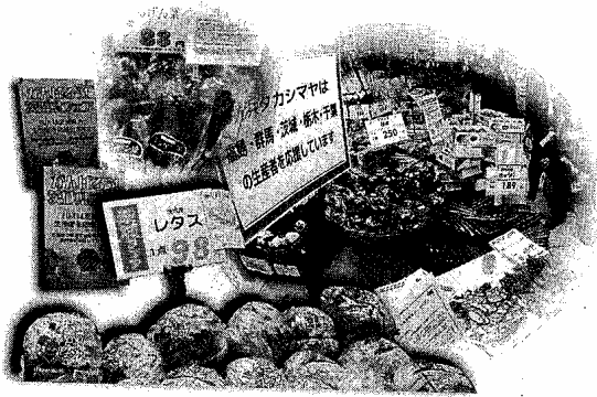
被災地周辺の農産物を積極的に扱い、生産者支援に協力する動きが広がっている

のためにもならない。イベントを通じて横浜から被災地に元気を届けたい」と話す。収益金はすべて世界食糧計画(WFP)・日本事務所を通じて被災地に寄付する。午後5時半と同7時半の2部制チケットは4千円。公式サイトから購入できる。問い合わせは、開催事務局 045(633)9660 平日午前10時〜午後5時半。